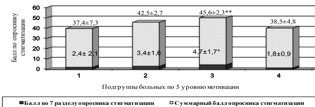
Рис. 3. Зависимость между 5 уровнем мотивации к лечению и стигматизирующими установками (* p \leq 0,05 в сравнении с 4 подгруппой; ** p \leq 0,05 в сравнении с 1, 2 и 4 подгруппами).