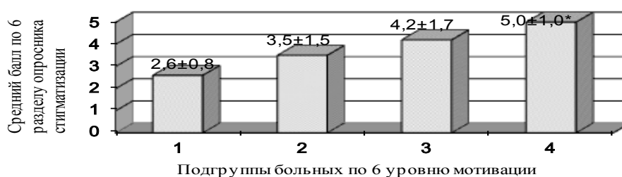
Рис. 4. Зависимость между 6 уровнем мотивации к лечению и стигматизирующими установками (* p \leq 0,05 в сравнении с 1 и 2 подгруппами).

рации (6 уровень мотивации к лечению), достоверно различалась выраженность стигматизирующего представления о невозможности присмотра за детьми психически больным человеком даже в случае его стабильного состояния. Пациенты, имевшие наивысшие баллы по 6 уровню мотивации, в наименьшей степени разделяли эту дискриминационную установку (рис. 4).